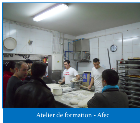
Atelier de formation - Afec

Cette classe européenne présente un triple atout pour les publics bénéficiaires : l'acquisition de nouvelles compétences dans le domaine du développement durable et de l'écotourisme, l'expérimentation en parallèle d'une expérience de mobilité européenne avec le Portugal et la possibilité à terme de valoriser un cursus de formation européen dotée d'un système de validation propre et reconnu dans les Etats-membres.